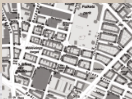
Møllevången 2004 182 invånare/hektar

Lindängen har idag ca 3000 bostäder. I uppgiften ingår att undersöka om ytterligare 1500 bostäder (127 500 m 2 ) kan integreras i området, i form av lägenheter, kollektivhus, radhus, villor etc. Lindängen skall också kompletteras med 40 000 m 2 service och handel (butiker, offentlig service, skolor, institutioner etc.) Slutligen skall det planeras för 30.000 m 2 uterum (aktiviteter, sport och fritid, grönområden, planteringar etc).