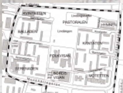
Lindängen 2004 63 invånare/hektar